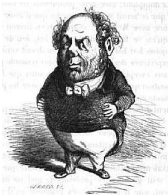
Caricature de Boulay de la Meurthe en 1848 par Cham.